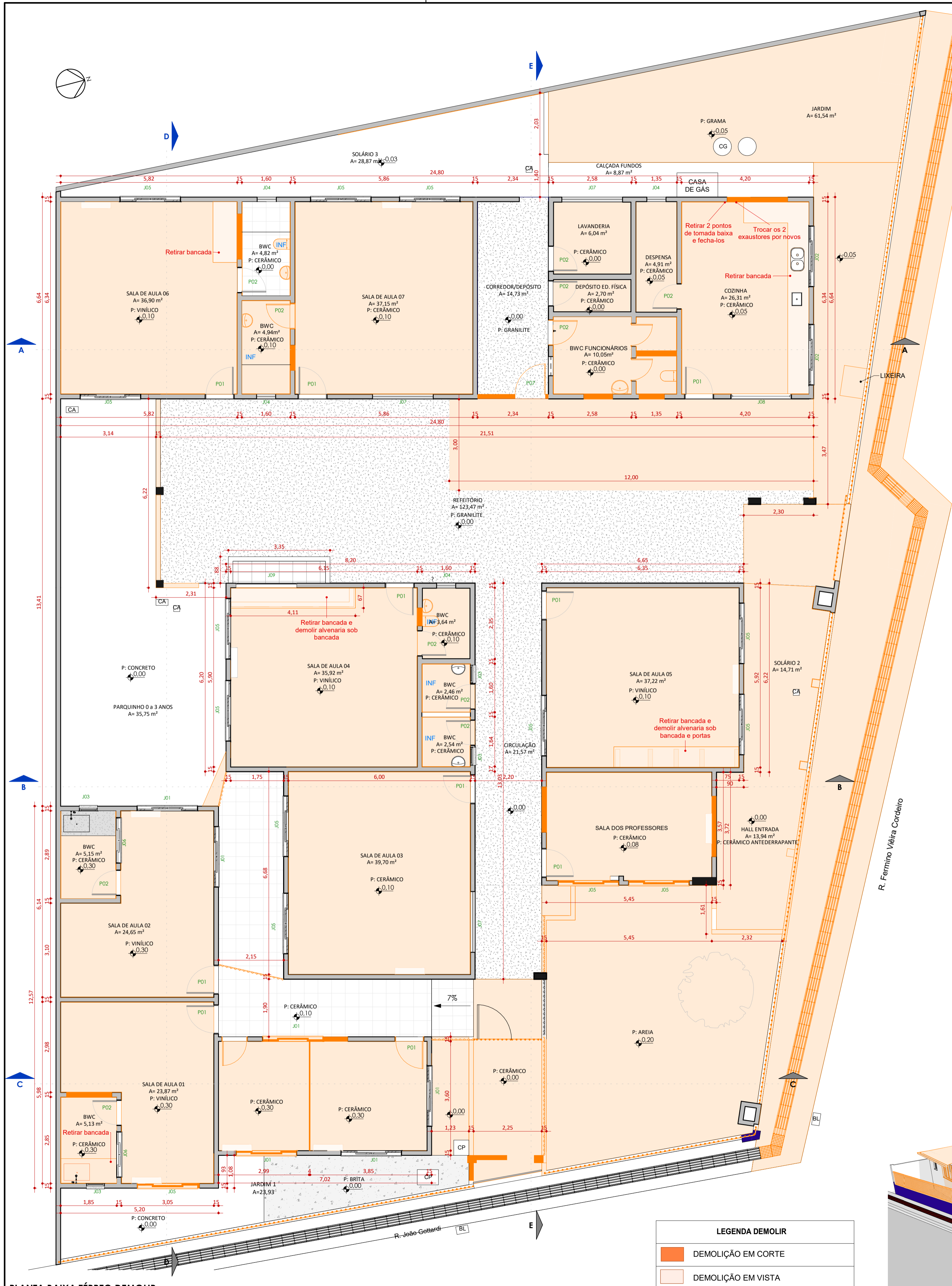
PLANTA BAIXA TÉRREO DEMOLIR ESC:1 : 75